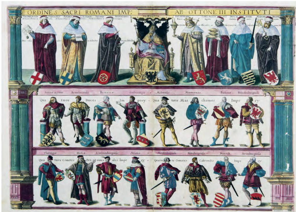
Kolorierter Kupferstich von Anton Wierix (um 1552 bis um 1624). Aus der englischen Ausgabe des „Theatrum orbis terrarum“ von Abraham Ortelius, 1606

Kapitellen als Rahmung gesetzt. In der obersten Reihe erscheinen die sieben Kurfürsten, in deren Mitte der Kaiser thront. Darunter folgt die Reihe der jeweils vier Herzöge und Markgrafen. Darunter sind die Landgrafen und Burggrafen in eine Reihe gesetzt. Inschriften über den Figuren erleichtern die inhaltliche Zuordnung. Im Zusammenhang mit dem Reichskammergericht. Die weltlichen und geistlichen Reichsstände des Heiligen Römischen Reiches Deutscher Nation waren diejenigen Personen und Korporationen, die Sitz und Stimme im Reichstag besaßen. Der Kupferstich stammt von Antonius Wierix, einem Kupferstecher des 17. Jahrhunderts, der einer flämischen Kupferstecherfamilie angehörte und vor allem in Brüssel und Antwerpen tätig war. Er hinterließ ein umfangreiches druckgrafisches Werk von über 2000 Werken.