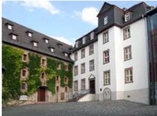
Stadt- und Industriemuseum/ Deutschordenshof

Die Begehungen des Lottehauses und des Stadt- und Industriemuseums fanden am 10.10.2014 statt.